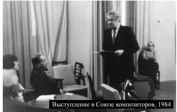
Выступление в Союзе композиторов, 1984