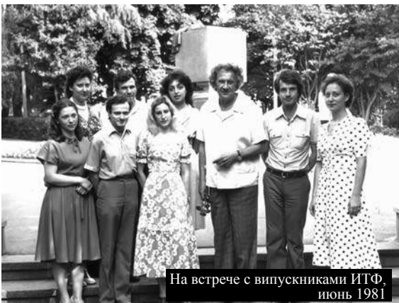
На встрече с выпускниками ИТФ, июнь 1981