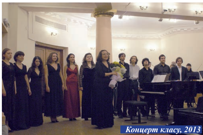
Концерт класу, 2013