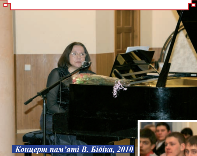
Концерт пам'яті В. Бібіка, 2010

«Нужно ли доказывать, как важна для нас именно музыкальная классика – она дает ощущение внутренней гармонии, она позволяет вырваться из плена суеты, учит духовной стойкости, в нашей сегодняшней драматической реальности мощно подпитывает энергетически» (1999 р.)