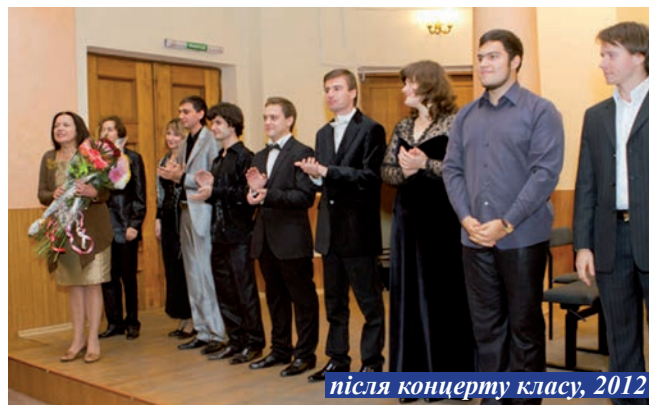
після концерту класу, 2012

С любовью, Ваш класс, который всегда рядом