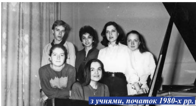
з учнями, початок 1980-х рр.