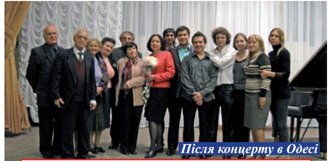
Після концерту в Одесі